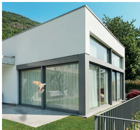
Vogelschlag – ein ernstzunehmendes Problem in Deutschland. Bild 69c90087

Das sind allerdings nicht nur unschöne Vorschläge, die in der Praxis bei großen Gebäuden nicht umsetzbar sind, sondern sie versperren auch die Sicht. Eine Alternative dazu bietet Vogelschutzglas, das mithilfe von Laserbearbeitungsmaschinen produziert wird. Durch den Laser wird das Glas so manipuliert, dass die Transparenz beziehungsweise die Reflektionen des Glases gebrochen werden. Dadurch können Vögel die Oberfläche sofort sehen und fliegen nicht mehr dagegen. Was also für Menschen kaum einen Unterschied macht, entscheidet bei den Tieren über