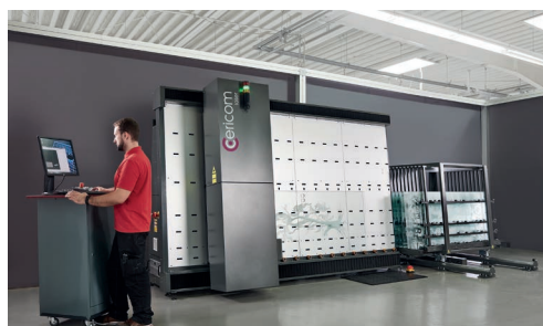
c-vertica: Laserbearbeitungssystem für Flachglas in Schrägbettausführung. Bild 69c00024