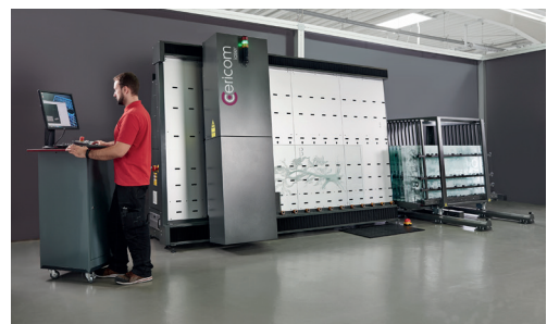
c-vertica 180-300 mit Magazinwagen Bild 69c00024