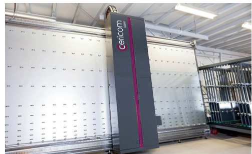
Glasbearbeitung mit dem Laser in Vertikalausrichtung Bild 69c90060